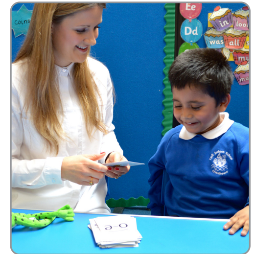
آموختن Speed Sounds در صنف.