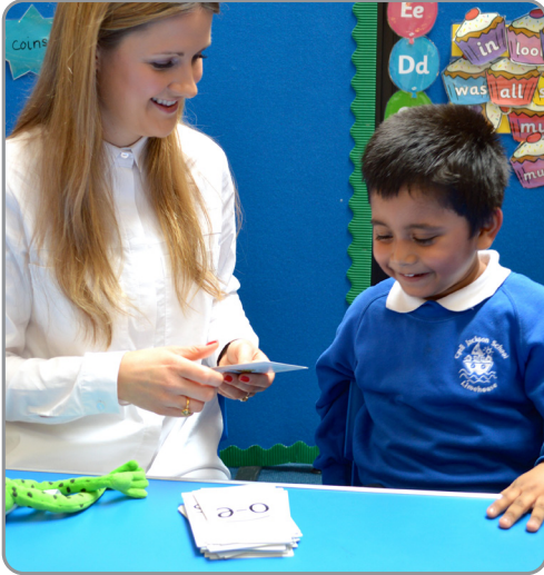
ક્લાસમાં Speed Sounds શીખવા વિશે.